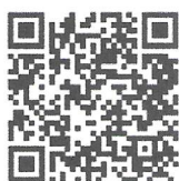
(นายสุรพล เจริญภูมิ) รองอธิบดี ปฏิบัติราชการแทน อธิบดีกรมส่งเสริมการปกครองท้องถิ่น